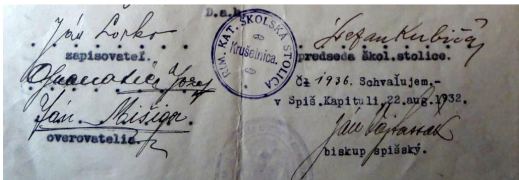
Biskupov podpis na schválení rozšírenia starej školy v Krušetnici o tretiu triedu, v roku 1932

Krušetnici pomohol materiálne pri stavbe novej rímsko-katolíckej ľudovej školy v roku 1942, keď súhlasil s prevozom tehly zo stavby školy v Zákamennom do Krušetnice a v roku 1932 dal súhlas na rozšírenie starej školy o tretiu triedu.